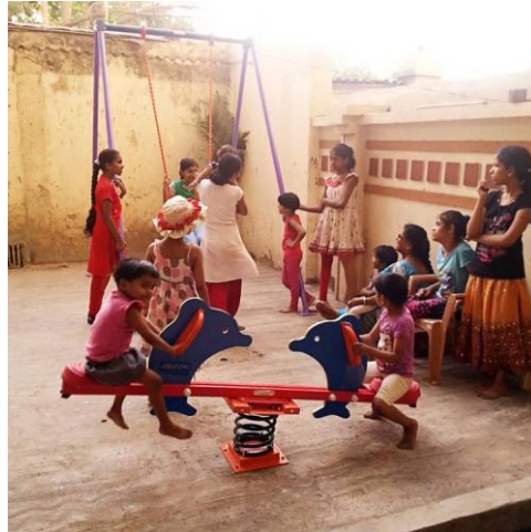
Het nieuwe begin is er!