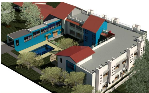
Aerial View From South

Schroomt u niet om te informeren naar de mogelijkheden en de voorwaarden m.b.t. het verrichten van vrijwilligerswerk in Bal Anand en/of op Umang: info@stichtingbalanand.nl