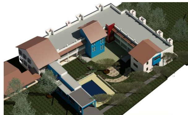
Aerial View From North

PROJECT UMANG AT VANJARWADI, KARJAT BY WORLDCHILDREN WELFARE TRUST INDIA