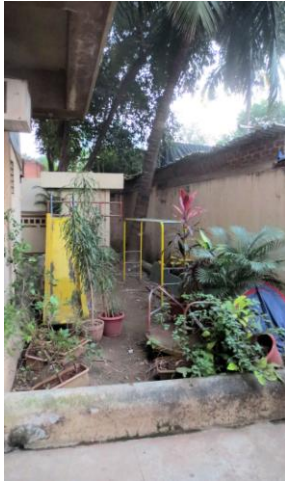
Tot voor kort.

In de vorige nieuwsbrief konden we melden en laten zien dat, dankzij gulle gevers, de noodzakelijke renovatie en gedeeltelijke vernieuwing van de lift in Bal Anand konden worden gerealiseerd. Een andere voorziening die in de behoeften voorziet is het speeltuintje aan de achterkant van Bal Anand. Ook nuttig voor de motoriek van de kinderen. Deze speelplek was aan vervanging toe en één van de Nederlandse vrijwilligsters besloot om hiervoor geld te gaan ophalen.